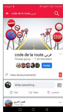
Micheline et Basel Ackl signale cette application sur Facebook