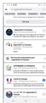
En français au-dessus

Elle conseille d'envoyer également la version française de la lettre aux familles afin qu'ils apprennent en même temps.